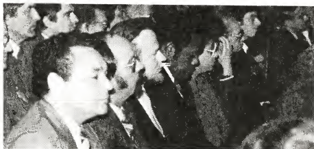
Un bista di un parti di e delegacion Arubano durante e apertura di e prome parti di e Conferencia di Mesa Redonda den e "Ridderzaal" na Den Haag.

— E miembronan di Isla Ariba ta di opinion cu e islanan aki no mester haci uso di e Derecho di Auto-Determinacion den sentido di un opcion pa independencia, ni separadamente, ni nan tres hunto, ni como parti di un Constitucion Antiyano. Nan ta duna preferencia por lo pronto na e mantencion di lazonan estatal entre Isla Ariba y Hulanda. Nan ta di opinion cu en principio e ordenamiento huridico actual mester sigui existi. Ademá, nan ta dispuesto na coopera cu cambianan den e ordenamiento huridico aki.